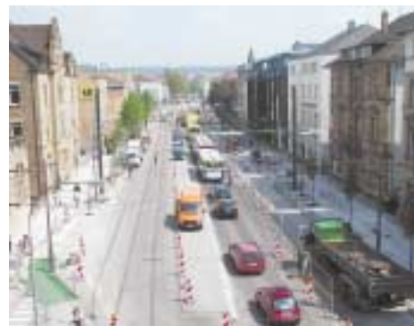
Bahnhofstraße: Blick vom Bahnhofsvorplatz in Richtung Kurt-Schumacher-Platz