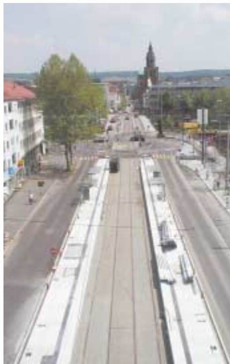
Bahnhofstraße: Blick auf die neue Haltestelle Kurt-Schumacher-Platz

Parkplätze Stadteinwärts befindet sich eine Liefer- und Ladezone an der Südseite des Bahnhofsvorplatzes. Als Parkmöglichkeit stehen Längsparkstände zwischen dem Hotel Altea und der ADAC-Geschäftsstelle und vor dem Haus Bahnhofstraße 9 zur Verfügung. Ein reichhaltiges Angebot hinter der Hauptpost ergänzt das Parkplatzvolumen in der Bahnhofstraße.