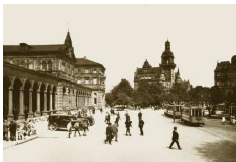
Das war einmal: Der Heilbronner Bahnhofsvorplatz um die Jahrhundertwende

Beim Anblick der grafischen Veranschaulichung werden Erinnerungen an die früheren Tage der Heilbronner Bahnhofstraße wach. Damals, vor dem Krieg, war der Bahnhofsvorplatz mit seiner markanten