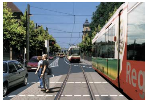
Alle Verkehrsteilnehmer sind gleichberechtigt

Bei richtiger Lösung ergibt sich von oben nach unten gelesen ein Schlüsselprojekt der Gestaltungsoffensive Innenstadt