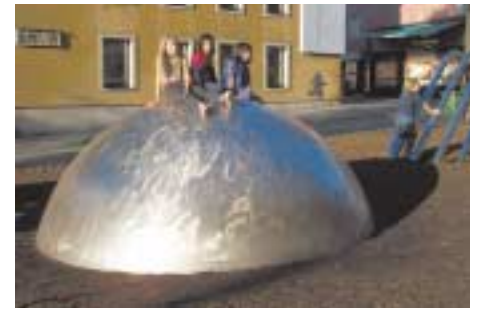
Das Spielgerät »Kleiner Berge« findet großen Anklang

wirtschaftlichen Berechnungen kostengünstiger als weiterhin allein auf den Neu- und Ausbau von Straßen zu setzen. Krüger betonte, dass die Einführung von Stadtbahnsystemen eine intensive interkommunale Zusammenarbeit zwingend erfordere. Neue Aspekte vermittelte der Stadtbahn-Experte den Marburger Verkehrsplanern hinsichtlich des Fahrpreises. Nicht der Preis allein sei ausschlaggebend für den Erfolg, sondern der Service und ein komfortables, kundenbezogenes Angebot. Dies reiche von der Ausstattung der Stadtbahnwagen über die Fahrplangestaltung bis hin zum benutzerfreundlichen Fahrkartenaufbau.