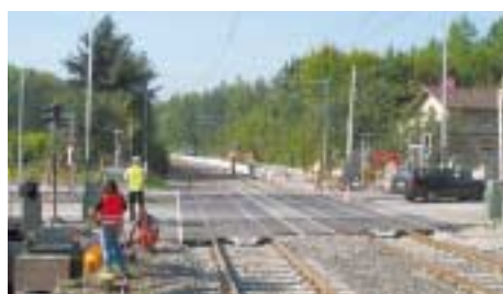
Jetzt wieder zweigleisig: Bahnübergang am »Sonnenbrunnen« in Heilbronn-Böckingen