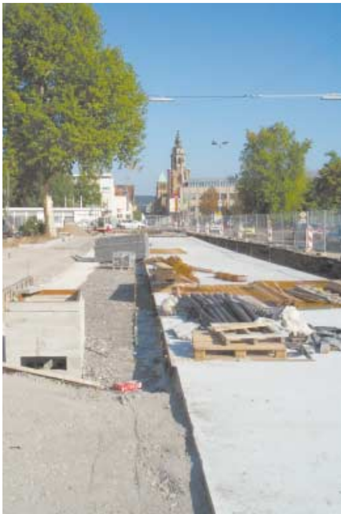
Gleis-Beton-Platte in der Bahnhofstraße/Kurt-Schumacher-Platz

Vorbereitung für die Gleisverlegung in der Bahnhofstraße