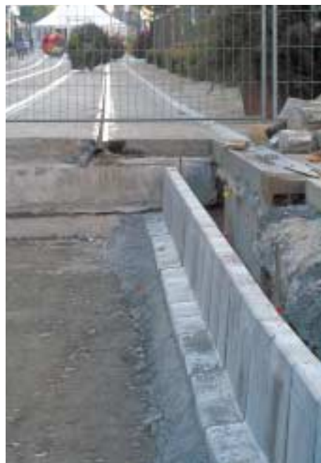
Straßenprofil mit Gleisen und Unterbau