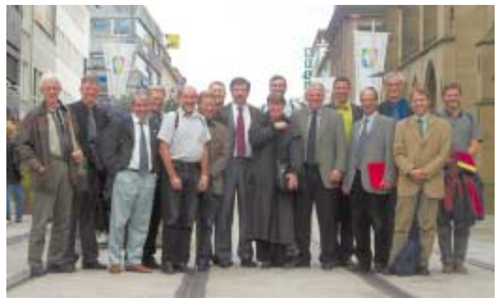
Die Gäste aus Stavanger auf den Gleisen der Stadtbahn in der Kaiserstraße

Norwegische Delegation begutachtet Heilbronner Stadtbahnkonzept