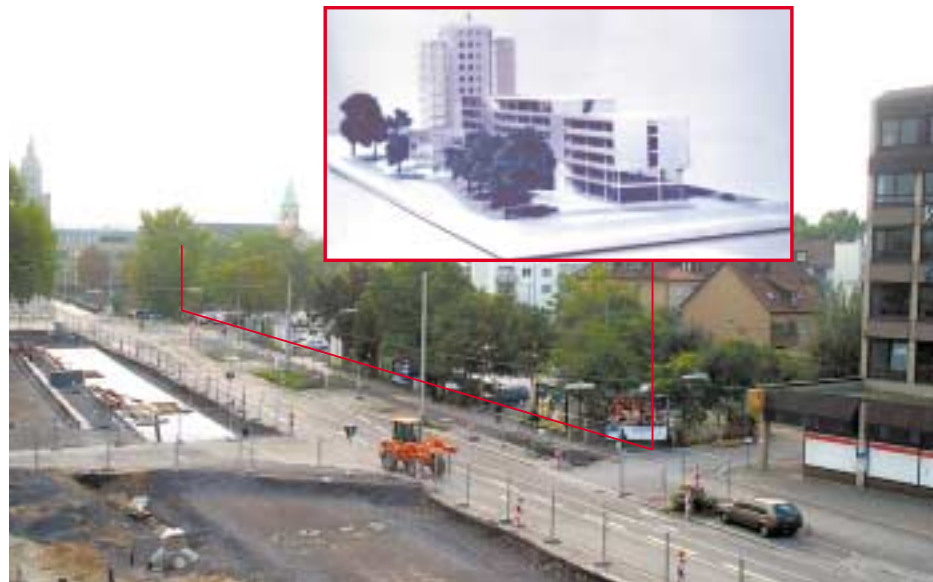
Der Neckar-Turm im Modell – und die Baustelle in der Bahnhofstraße. Das Gebäude wird südlich der Bahnhofstraße in Richtung Friedrich-Ebert-Brücke entstehen (rote Linie).

Kurt-Schumacher-Platz mit attraktiver Überbauung